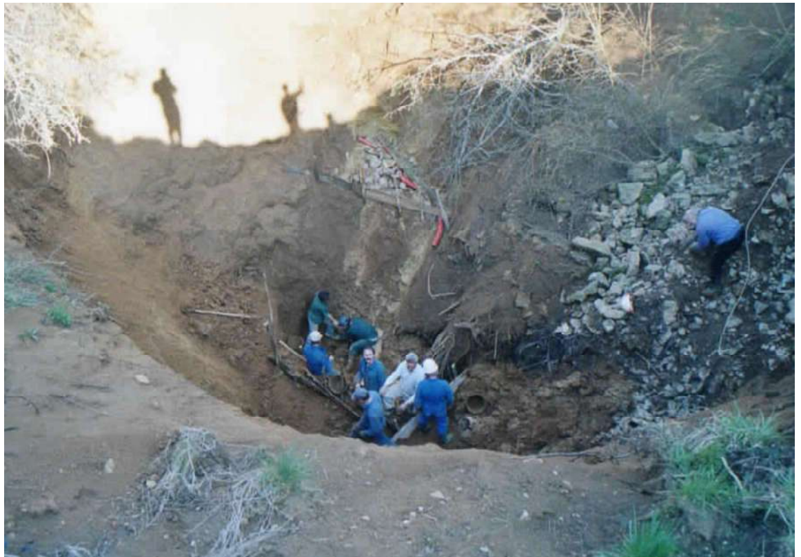
Perte des Ménétrières Vergisson - 2003 ➤